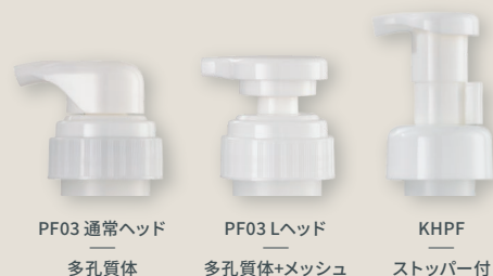
PF03 通常ヘッド 多孔質体

ヘアケア、コスメティック、バス・トイレタ リー用品、キッチン用品、ベビー衛生用品 その他、幅広い用途に